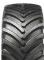
Agrimax RT 600