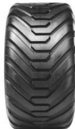
ВКТ Flotation 648