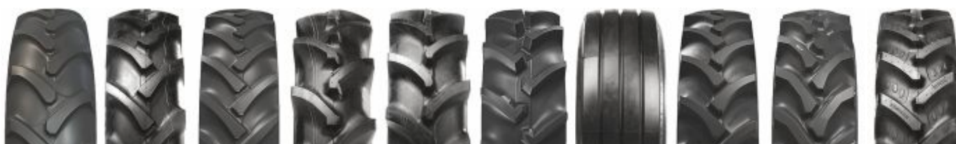
Agrimax RT 855