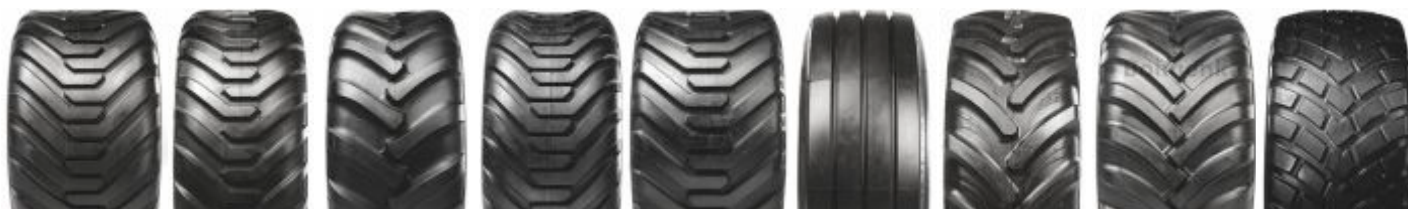
Ridemax FL 693 M