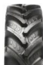
Agrimax RT 765