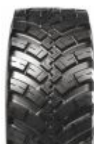
Agrimax IT 697