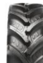
Agrimax RT 765