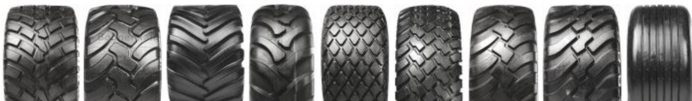
Flotation Rib 774