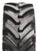
Agrimax RT 657