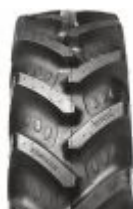
Agrimax RT 855