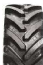
Agrimax RT 657