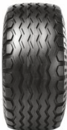
ВКТ АW 705