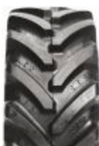
Agrimax RT 657