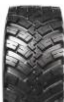
Agrimax IT 697