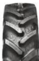
Agrimax RT 855