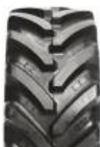
Agrimax RT 657