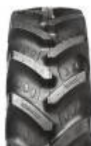
Agrimax RT 855