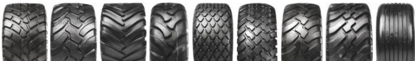
Flotation Rib 774