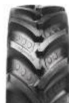
Agrimax RT 765