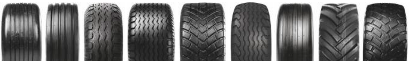
Rib 774(A) Rib 774(C) AW 909 AW 708 AW 726 AW 09 Rib Implement(B) AS 504 Ridemax FL 693 M