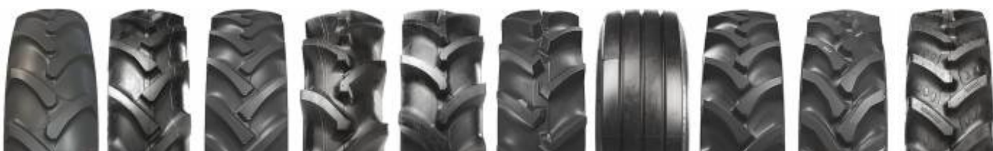
Agrimax RT 855