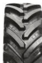
Agrimax RT 657