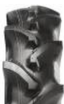
Agrimax RT 765