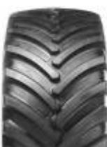
Agrimax RT 600