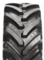
Agrimax RT 657