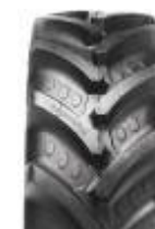
Agrimax RT 765